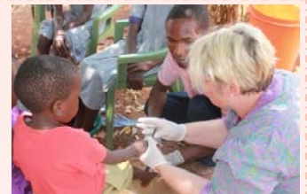
Omsorg for barna handler også om helsestell. Her behandles de for jiggers.

Det opprettes 1,5 stilling som barneombud. Ordningen skal sørge for at barns behov, rettigheter og interesser blir tatt hensyn til både hjemme og i det lokale samfunnet. De skal passe på at lovgivning om barns rettigheter blir fulgt. Sentralt er barns rett til omsorg og