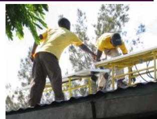
Solpaneler og solar cookers på ARO

ARO Fablab har også fått godkjent støtte i tre år framover, og blir en viktig støttespiller til den nye skolen. I det hele tatt blir miljøteknologi stadig mer sentralt i arbeidet. Vi har bl.a. innledet et samarbeid med UiA, Grimstad campus om å utvikle et større solvarmedrevet kjøkken.