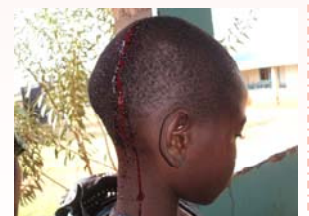
Jenta på 6 år ble slått i hodet med en stokk. En av mange mishandlingshistorier mot barn som skjer i området. Mer om denne historien kan du lese på vår nettside under "Unnis reiseblogg fra Kenya".

beskyttelse (FNs barnekonvensjons 4. hovedprinsipp). Barneombudet skal være et sted hvor alle, men spesielt barn, kan henvende seg.